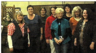
Der Vorstand des Tierschutzes Euskirchen wurde im Dom Escher Hof im Amt bestätigt.

Die Jahresbilanz weist folgende Zahlen und Aktivitäten aus: Gemeinsam mit Kommunen und Kreisveterinäramt Euskirchen wurden „Kastrationsaktionen“ an wildlebenden Katzen durchgeführt. Kreis, Kommunen, Landesamt für Natur, Umwelt und Verbraucherschutz NRW sowie der Tierschutzverein beteiligten sich finanziell an der Aktion. Die Tierärzte halfen ebenfalls: Sie berechneten für die Aktionen mit Genehmigung der Tierärztekammer einen sehr